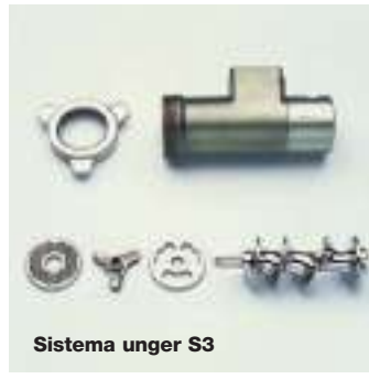
Sistema unger S3