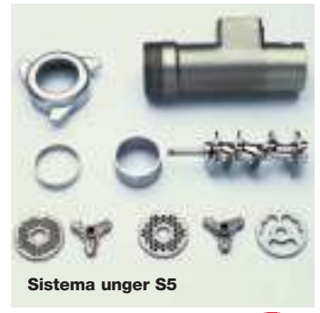
Sistema unger S5